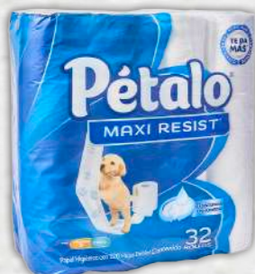
PÉTALO Maxi resist

Este modelo tardó 866 segundos (casi 15 minutos) en desintegrarse: