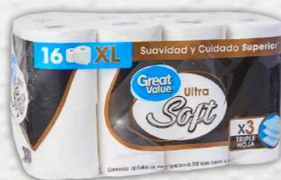
GREAT VALUE Ultra Soft

Al siguiente modelo le tomó 28 segundos (casi medio minuto) desintegrarse: