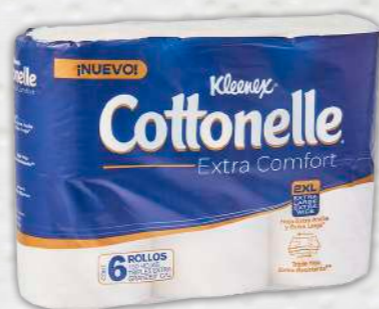
KLEENEX COTTONELLE Extra confort

El siguiente modelo tardó 202 segundos (poco más de 3 minutos) en desintegrarse: