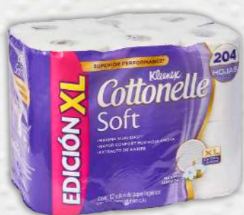
KLEENEX COTTONELLE Soft

Este modelo tardó 14 segundos en desintegrarse: